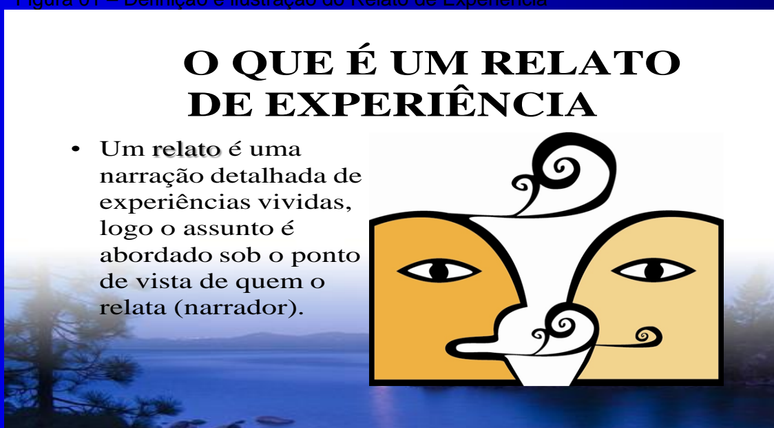
Figura 01 – Definição e ilustração do Relato de Experiência