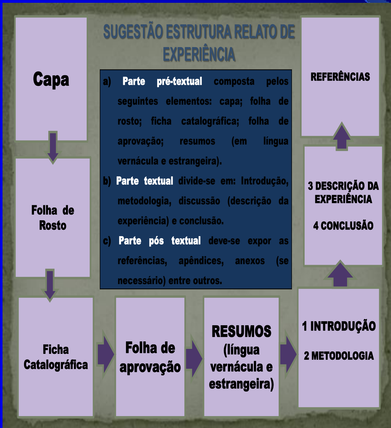
Figura 03 – Sugestão para estrutura formal do Relato de Experiência.