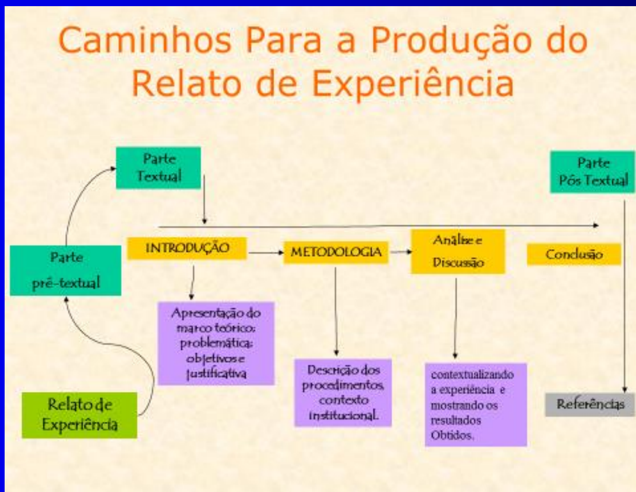
Figura 02- Caminhos para a elaboração do relato de experiência.